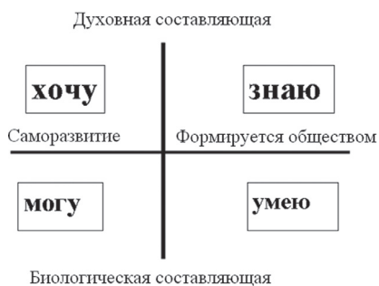
Рис. 1. Ресурсы учебного успеха